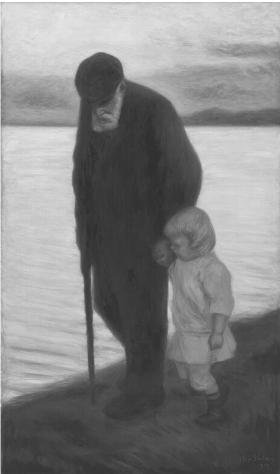
HUGO SIMBERG / "ILTAA KOHTI"